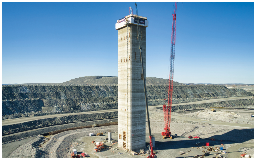
Figure 1 : construction du puits de production à Odyssey – Cliquez ici pour plus de détails

Osisko détient une redevance en rendement net de fonderie ( net smelter return ou « NSR ») de 5 % sur East Gouldie, Odyssey South, East Amphi et sur la moitié ouest d'East Malartic, et une redevance NSR de 3 % sur Odyssey North et la moitié Est d'East Malartic. Pour de plus amples informations, veuillez vous référer aux communiqués de presse de Yamana datés du 7 septembre et du 1 er décembre 2021, et aux communiqués de presse d'Agnico datés du 8 juillet et du 2 novembre 2021, et déposés sur le www.sedar.com .